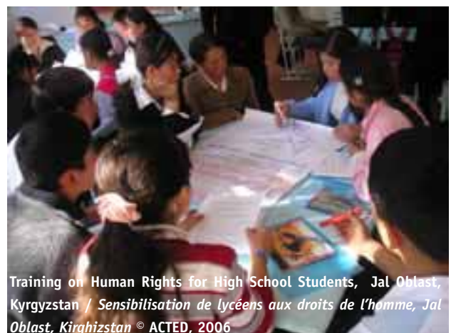
Training on Human Rights for High School Students, Jal Oblast, Kyrgyzstan / Sensibilisation de lycéens aux droits de l'homme, Jal Oblast, Kirghizstan

Dans l'ensemble des activités destinées à garantir la sécurité alimentaire ou à soutenir le développement économique local, ACTED introduit une composante de formation à l'intention des personnes bénéficiaires. Cette composante est proposée dès la phase de réhabilitation des programmes d'aide. A titre d'exemple, la construction d'abris s'accompagne de formations dispensées sur différents métiers comme la maçonnerie ou la charpenterie, et les actions de soutien agricole, par des formations sur l'utilisation des semences et les meilleures pratiques dans le domaine. Avec le temps, le contenu des formations évolue en approfondissant les aspects techniques afin de permettre aux bénéficiaires d'acquérir une réelle valeur ajoutée en développant des compétences spécifiques, non