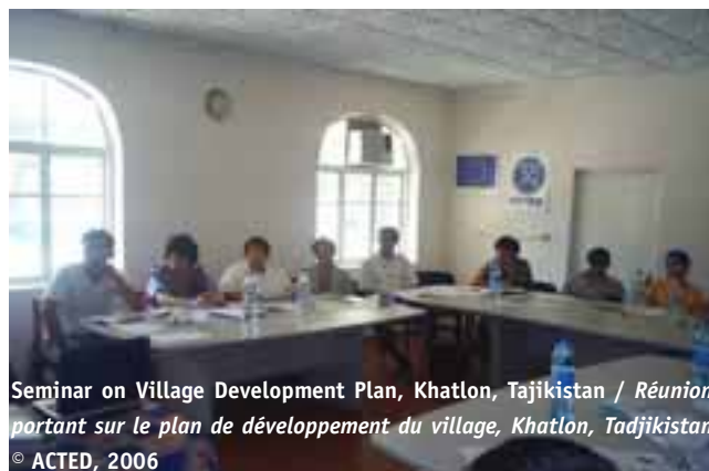
Seminar on Village Development Plan, Khatlon, Tajikistan / Réunion portant sur le plan de développement du village, Khatlon, Tadjikistan

Oxus Development Network (ODN) is progressively taking over ACTED's interventions in the microfinance sector. Nevertheless, certain individuals in a situation of extreme vulnerability do not always fulfil Oxus' selection criteria. For this reason, ACTED has maintained its microfinance activities for the most vulnerable community members. In all cases, the focus is on the mobilization of local solidarities in the form of solidarity-based groups, agricultural unions, parent/teacher associations, as well as village banking organizations. ACTED considers that supporting local economic initiatives is an indispensable condition for the sustainable development of regions severely affected by a crisis.