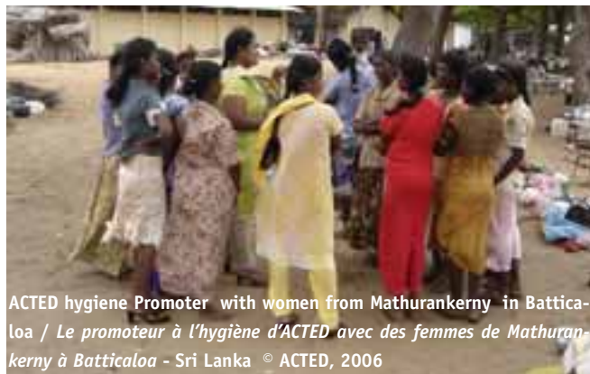
ACTED hygiene Promoter with women from Mathurankerny in Batticaloa / Le promoteur à l'hygiène d'ACTED avec des femmes de Mathurankerny à Batticaloa - Sri Lanka

personnelle et environnementale, la gestion des déchets domestiques, le planning familial, etc. A l'issue de ces sessions, les animateurs du réseau sont chargés de diffuser les messages de santé publique aux membres de leur communauté.