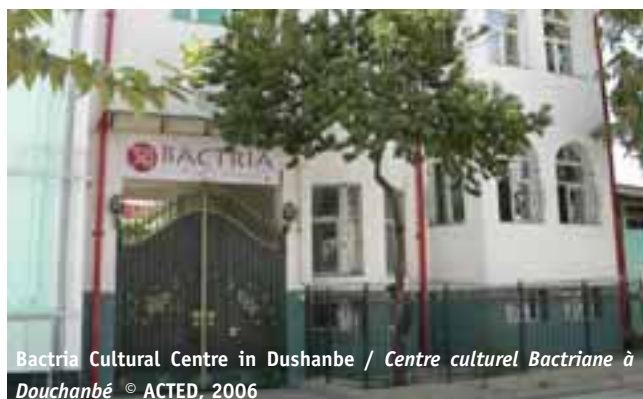
Bactria Cultural Centre in Dushanbe / Centre culturel Bactriane à Douchanbé

Élaborer des solutions durables pour le développement a conduit ACTED à initier et encourager des initiatives de commerce équitable, comme moyen de renforcer les capacités économiques de ces acteurs tout en soutenant la production d'artisanat traditionnel. ACTED privilégie les initiatives de commerce équitable et d'écotourisme afin de stimuler l'économie locale. Ces initiatives sont encouragées dans des zones où la production et les activités économiques sont plus difficiles en raison de conditions naturelles peu propices (zones montagneuses notamment). ACTED soutient les initiatives de commerce équitable et d'écotourisme dans les zones reculées ou enclavées où les échanges sont plus difficiles.