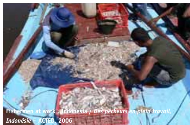
Fishermen at work, Indonesia / Des pêcheurs en plein travail, Indonésie

L'implication des communautés est au cœur de nos programmes de réhabilitation d'infrastructures collectives.