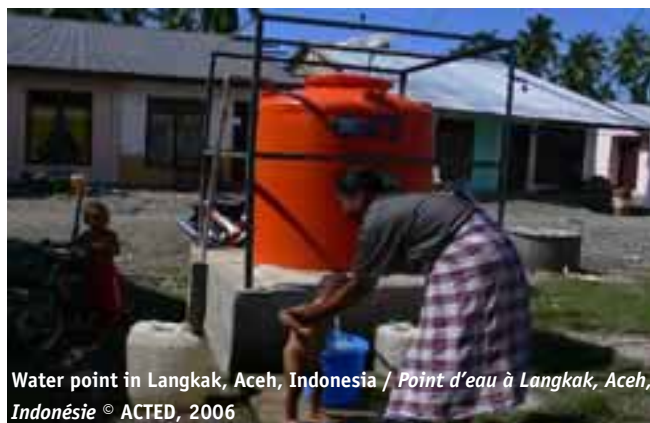
Water point in Langkak, Aceh, Indonesia / Point d'eau à Langkak, Aceh, Indonésie

Training sessions are organized for them on different themes such as drinking water, water and food storage, personal and