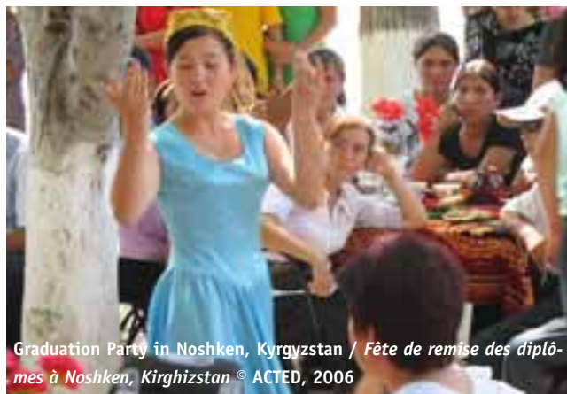
Graduation Party in Noshken, Kyrgyzstan / Fête de remise des diplômes à Noshken, Kirghizstan

In this way, one contributes to a participatory, equitable, transparent and efficient local development. For example, ACTED implements preventive actions in the health sector by closely associating the beneficiary communities as well as the sanitation authorities in order to ensure the sustainability of its interventions. Taking local governance into account represents a transversal theme of our interventions.