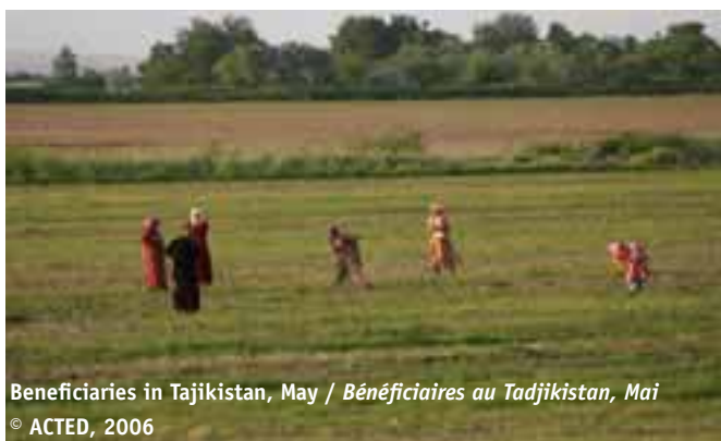
Beneficiaries in Tajikistan, May / Bénéficiaires au Tadjikistan, Mai

ACTED frequently intervenes in isolated rural areas where agriculture represents the key economic sector. In this context, agricultural support offers a perspective of real development when the activities are of long duration. For this reason, ACTED has developed a panel of activities destined to allow for an effective transition towards autonomous development. First of all, our activities include the distribution of seeds and tools (fertilizers, pesticides, but also basic tools such as wheelbarrows and shovels), generally accompanied by training sessions and demonstrations on land parcels in order to allow the beneficiaries to successfully take advantage of all aspects of the intervention. Thanks to the community involvement, these activities have evolved with the implementation of a collective management system (agricultural unions or banks) that provide access to better quality inputs at lower prices thanks to grouped transport and orders. This evolution has