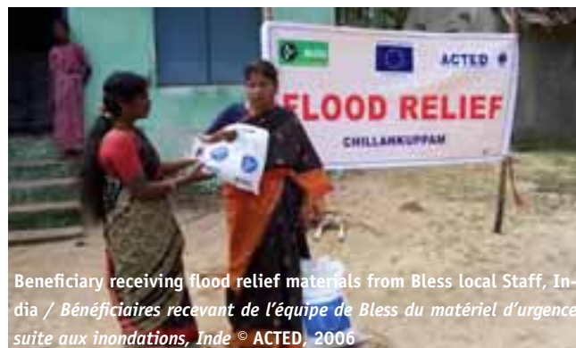
Beneficiary receiving flood relief materials from Bless local Staff, India / Bénéficiaires recevant de l'équipe de Bless du matériel d'urgence suite aux inondations, Inde

Nos programmes d'aide visent à satisfaire ces besoins matériels immédiats par le biais de distributions d'ustensiles et d'équipements de base ainsi que l'installation d'hébergements temporaires. A titre d'exemple, lorsque les conditions hivernales sont rigoureuses, les distributions auxquelles ACTED procède incluent des fours de cuisine et de chauffage, des couvertures et des tentes adaptées au grand froid. Dans ce contexte, la finalité de nos interventions est de satisfaire les besoins de première nécessité aussi bien en termes alimentaires que matériels.