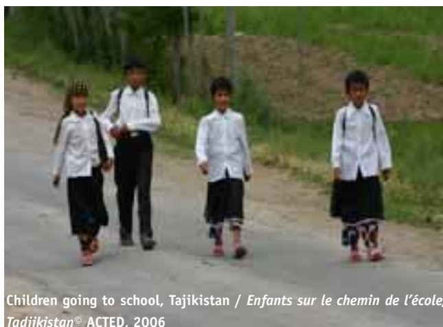
Children going to school, Tajikistan / Enfants sur le chemin de l'école, Tadjikistan