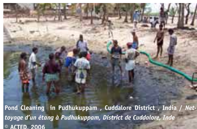
Pond Cleaning in Pudhukuppam, Cuddalore District, India / Nettoyage d'un étang à Pudhukuppam, District de Cuddalore, Inde

In many cases, the conditions in which water is used appear to be at least as important as its quality and salubrity. For this reason, ACTED's activities related to the rehabilitation of water springs, wells, or adduction networks are systematically implemented in close collaboration and with the participa-