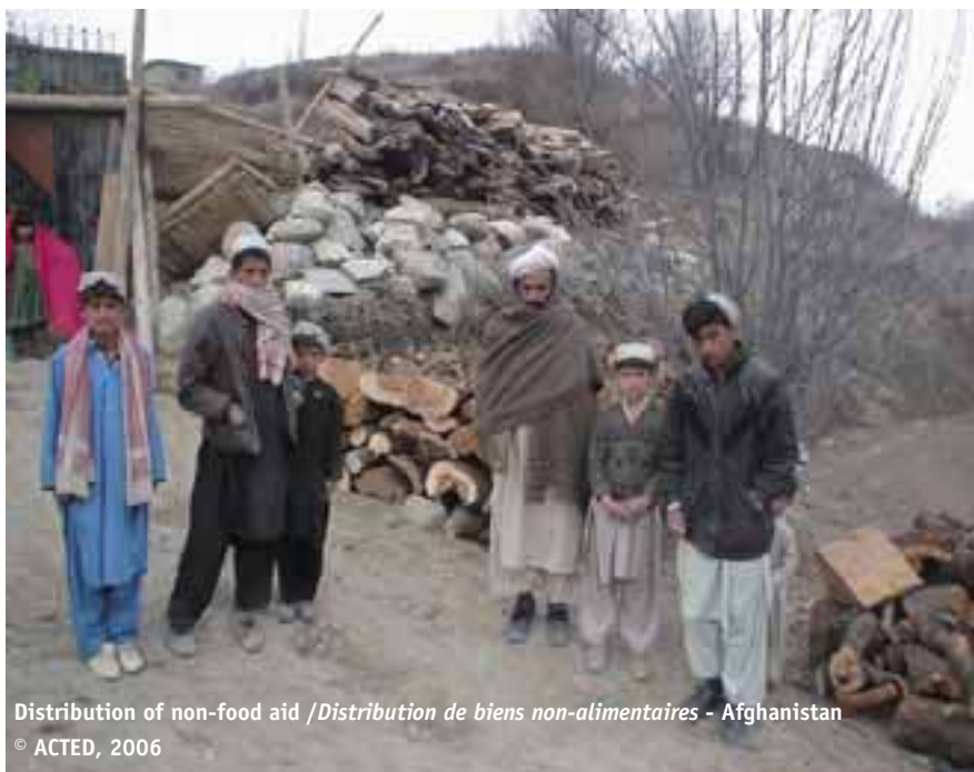
Distribution of non-food aid / Distribution de biens non-alimentaires - Afghanistan