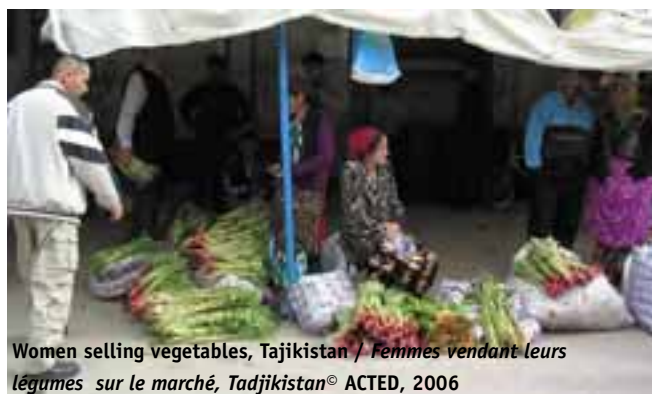
Women selling vegetables, Tajikistan / Femmes vendant leurs légumes sur le marché, Tadjikistan

These activities are geared towards the vulnerable layers of the populations, especially women (sewing, production of small objects to be sold at local markets) and non-qualified individuals (distribution of toolkits, basic training, etc.) in order to encourage regular income generation for the households in question.