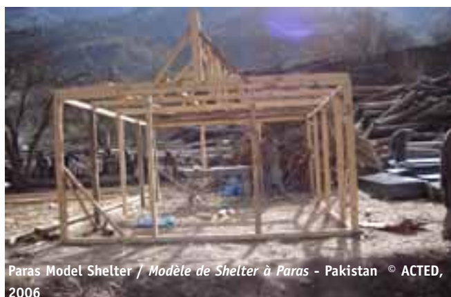
Paras Model Shelter / Modèle de Shelter à Paras - Pakistan

Encouraging the emergence of small businesses begins