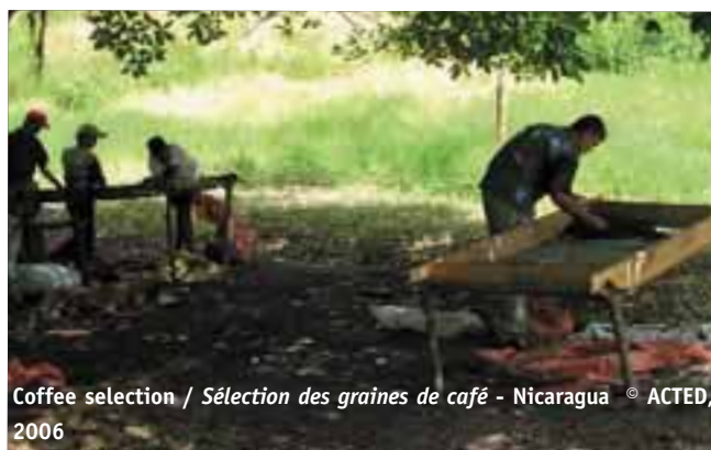
Coffee selection / Sélection des graines de café - Nicaragua

environnementales de ce manque d'entretien. Elles constituent autant de menaces pour la sécurité alimentaire auxquelles nous tentons d'apporter des réponses en impliquant les communautés concernées dans leur définition et leur mise en œuvre.