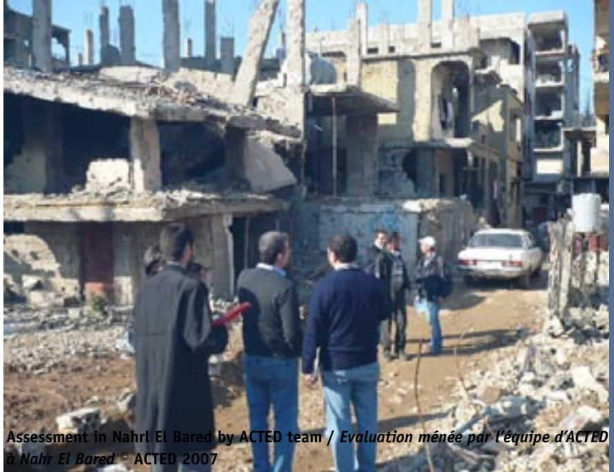
Assessment in Nahr El Bared by ACTED team / Evaluation menée par l'équipe d'ACTED à Nahr El Bared

Au début 2007, la mission a consolidé au Liban sa réponse post-urgence quant à la reconstruction au sud suite à la guerre de 2006 avec Israël. En réponse au conflit qui a éclaté dans le camp palestinien de Nahr El Bared au nord du Liban en mai 2007, ACTED a à nouveau porté ses efforts sur l'assistance aux milliers de réfugiés palestiniens déplacés touchés par cette nouvelle urgence.