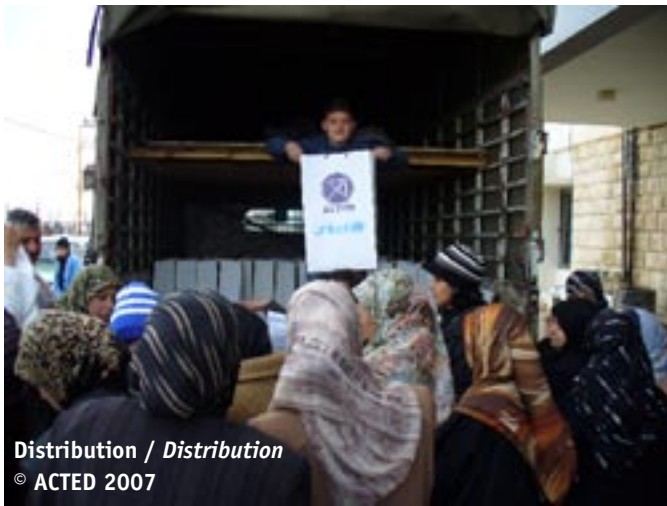
Distribution / Distribution

imited infrastructures. ACTED was in a good position to respond to this new emergency and as a result opened a new office in Tripoli in the North. The emergency response of ACTED which lasted throughout the remainder of 2007 was to provide water trucking and testing for the displaced families from NBC and their host communities in Beddawi, and to provide emergency repairs to housing damaged near the camp to facilitate the return of internally displaced persons (IDPs) and hence lessen the overcrowding in Beddawi.