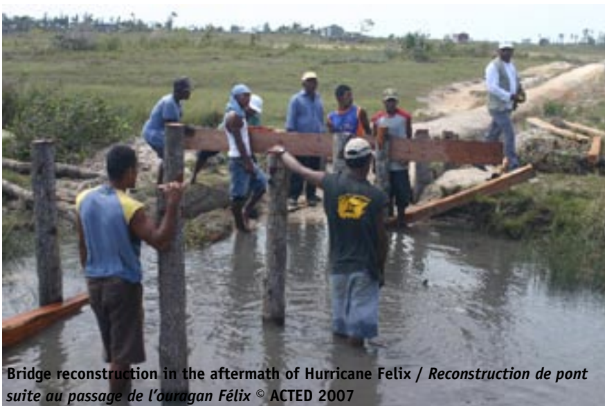
Bridge reconstruction in the aftermath of Hurricane Felix / Reconstruction de pont suite au passage de l'ouragan F lix   ACTED 2007

des risques (naturels ou anthropiques) auxquels ils sont expos s. En outre, un syst me d'alerte pr coce aux inondations est actuellement op rationnel dans la municipalit , transmettant en temps r el une information de qualit , depuis le niveau local jusqu'au niveau institutionnel national, gr ce   un travail constant de collecte et analyse de donn es en partenariat avec l'Institut National d'Etudes Territoriales. Parall lement   ces activit s d'identification des menaces et de mobilisation des populations locales autour d'une r ponse rapide et efficace   une catastrophe, des activit s de sensibilisation du grand public   la gestion des risques sont mises en  uvre afin d' tablir une culture de r silience et de s curit , en d veloppant chez les habitants une conscience et compr hension des vuln rabilit s et menaces caract ristiques du territoire.