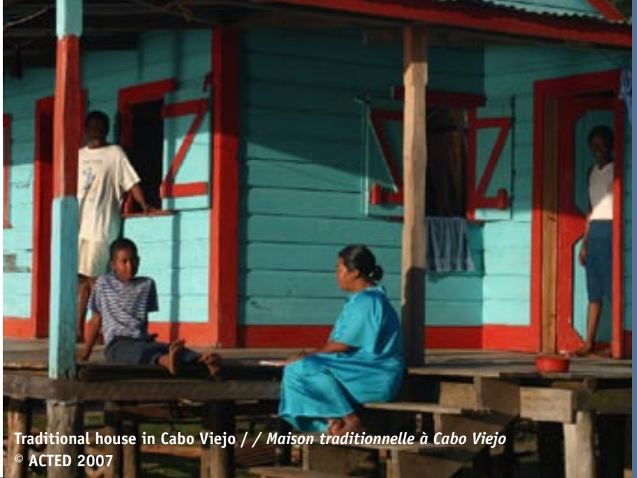
Traditional house in Cabo Viejo / / Maison traditionnelle à Cabo Viejo

L'année 2007 a marqué pour la mission Nicaragua un changement substantiel, avec le recentrage sur des actions d'urgence, tout en capitalisant sur nos 10 années de présence dans le pays, afin de développer une véritable approche globale de réduction de la vulnérabilité.