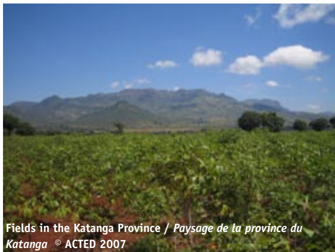
Fields in the Katanga Province / Paysage de la province du Katanga

ACTED's uninterrupted presence for 4 years, coupled with the signs of an improved political and social situation in the DRC, means that we are now in a position to capitalise on our work with our beneficiaries and our staff. Although