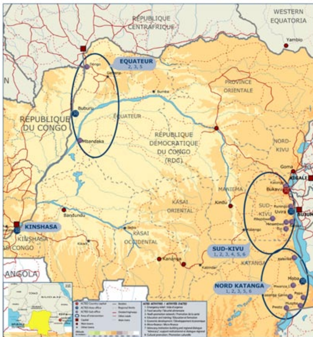
ACTED ACTIVITIES PER AREA OF INTERVENTION IN THE DEMOCRATIC REPUBLIC OF THE CONGO IN 2007 ACTIVITÉS D'ACTED PAR ZONE D'INTERVENTION EN REPUBLIQUE DEMOCRATIQUE DU CONGO EN 2007

Nombre total de bénéficiaires 300 265 bénéficiaires directs et indirects