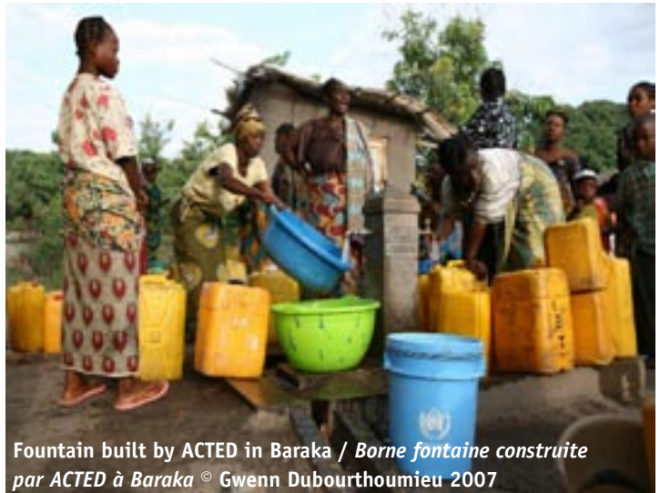
Fountain built by ACTED in Baraka / Borne fontaine construite par ACTED à Baraka

biliser les communautés autour de projets communs et les soutenir dans la redéfinition de leur identité communautaire ; les micro projets d'organisations non gouvernementales locales afin de soutenir le tissu associatif local florissant qui caractérise le pays ; l'appui à l'artisanat par les Activités Génératrices de Revenus (AGR) pour favoriser les savoirs faire locaux et relancer une dynamique économique dans des zones trop faibles pour soutenir ces initiatives ; le micro crédit pour réintroduire les échanges monétaires et former les bénéficiaires en outils de gestion, et enfin la relance de l'agriculture, de la pêche et de l'élevage pour permettre à ces populations de retrouver une certaine autosuffisance alimentaire. A titre d'exemple, ACTED a ainsi octroyé des micro crédits à 6 000 bénéficiaires en 2007.