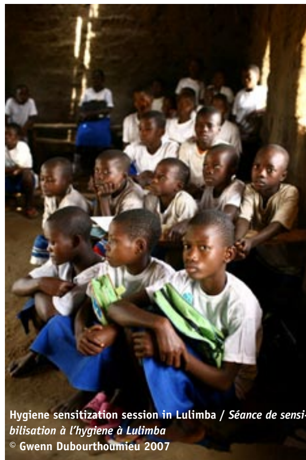
Hygiene sensitization session in Lulimba / Séance de sensibilisation à l'hygiène à Lulimba

ACTED's uninterrupted presence for 4 years, coupled with the signs of an improved political and social situation in the DRC, means that we are now in a position to capitalise on our work with our beneficiaries and our staff. Although the urgency of the situation remains, ACTED hopes to put down the foundations for longer term projects