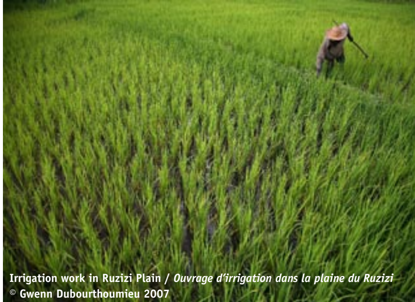
Irrigation work in Ruzizi Plain / Ouvrage d'irrigation dans la plaine du Ruzizi

ACTED favorise l'approche multisectorielle en RDC pour contribuer à la réinsertion durable des réfugiés et des déplacés dans leurs communautés d'origine.