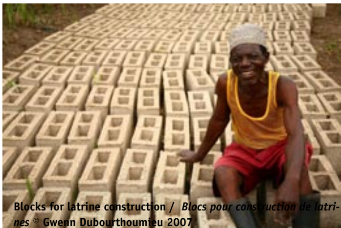
Blocks for latrine construction / Blocs pour construction de latrines

With project follow up firmly in place, it is time now to concentrate on strengthening existing partnerships with