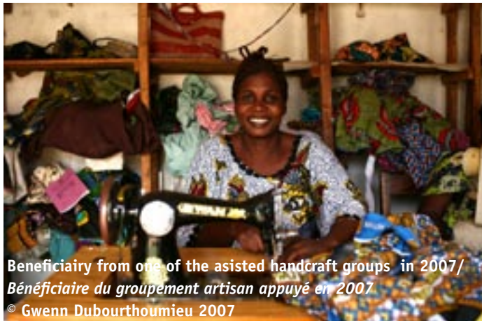
Beneficiary from one of the assisted handcraft groups in 2007/ Bénéficiaire du groupement artisan appuyé en 2007

In 2007, ACTED worked in three provinces in the DRC, South Kivu, Katanga and during the year, Equateur. Although these provinces required varying degrees of implication, South Kivu being a traditional zone of intervention whereas Equateur constituted a new challenge, our responses were based on the same intervention methodologies with global objectives applied to all three zones, differing only as regards themes. Most of the displaced persons in these zones returned as soon as they found a more stable environment, in particular as regards security and protection. In this context, we concentrated our action on the consolidation of minimum basic services, covering access to health, education and decent housing, for returning populations and those who stayed in their community of origin. We further tried to ensure the permanent return of the populations by supporting them in launching economic activities that generate revenues which allow them to regain their autonomy lost following years of conflict. Strengthened by its permanent partnerships with the European Commission, the United Nations, and some