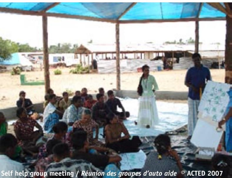
Self help group meeting / Réunion des groupes d'auto aide

A ce jour, ACTED n'a plus qu'un seul projet lié au tsunami, financé par CIDA, lancé en avril 2007, et dans le cadre duquel ACTED conduit des formations professionnelles, fournit des kits agricoles et d'élevage à 240 familles vulnérables. ACTED a également initié un fond de contrepartie qui permettra de réduire la dépendance des bénéficiaires face aux prêteurs locaux.