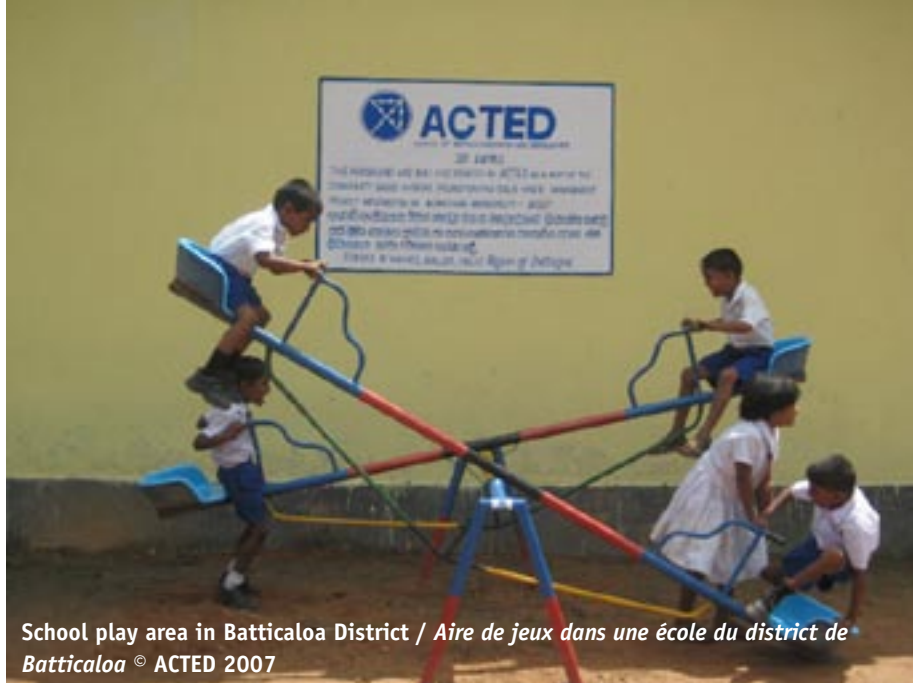
School play area in Batticaloa District / Aire de jeux dans une école du district de Batticaloa

L'année 2007 a constitué un défi pour ACTED au Sri Lanka qui a dû s'adapter régulièrement au contexte changeant du district de Batticaloa et les mouvements de déplacés. Par conséquent, ACTED a dû réadapter sa stratégie programmatique et passer d'interventions d'urgence à des opérations davantage tournées sur les besoins à plus long terme des populations retournées.