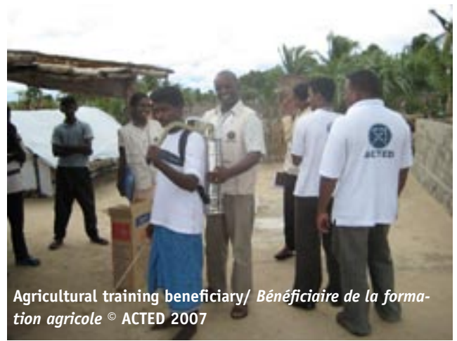
Agricultural training beneficiary/ Bénéficiaire de la formation agricole

As the IDP crisis subsided between April and September 2007 (by September only 33,000 IDPs remained with 15,000 in IDP camps), ACTED had to yet again adapt its strategy to the changing context. As the IDPs returned to their home areas in Vaharai (North Batticaloa) and in West Batticaloa District, ACTED undertook rapid assessments a) to determine the extent of destruction, damage and loss caused by the conflict in the areas of return and b) to identify potential activities to implement in these areas. As such, faithful to its strategy of integrated action, ACTED developed livelihood /infrastructure rehabilitation interventions in Vaharai and Vavunatheevu (South West Batticaloa District). As part of these projects, ACTED is supporting over 600 vulnerable households (over 30% of ACTED’s beneficiaries are female headed households) in resuming their livelihood activities through the provision of training, cash grants and the distribution of input packages